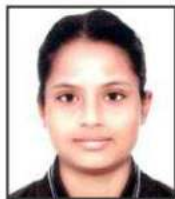
Komal Handball All India North Zone Inter-University Participation