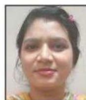
Lovely M.Sc.(IT) Sem-II 81%