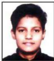
Himani Volleyball All India North Zone Inter-University Youth National Participation