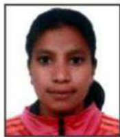
Sonia Softball All India Inter-University Baseball Senior National Federation Cup 1st Position